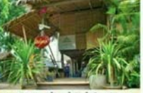
วิถีชีวิตชุมชน บ้านโป่งสนิม สวนไม้กวาด

บ้านโป่งสนิมเป็นหมู่บ้านที่มีวิถีชีวิตชุมชนที่เข้มแข็งและมีความเป็นอยู่ที่ดี โดยประชาชนในหมู่บ้านได้ร่วมกันพัฒนาและปรับปรุงสภาพแวดล้อมให้ดีขึ้น