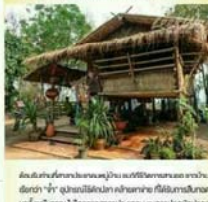
วิถีชีวิตชุมชน บ้านโป่งสนิม สวนไม้กวาด