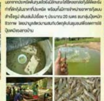
วิถีชีวิตชุมชน บ้านโป่งสนิม สวนไม้กวาด

บ้านโป่งสนิมเป็นหมู่บ้านที่มีวิถีชีวิตชุมชนที่เข้มแข็งและมีความเป็นอยู่ที่ดี โดยประชาชนในหมู่บ้านได้ร่วมกันพัฒนาและปรับปรุงสภาพแวดล้อมให้ดีขึ้น