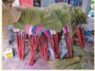
ไม้กวาดใบไม้กวาดที่ทำจากผ้า เป็นวิถีชีวิตของคนทำบ้านโป่งสนิม คนโป่งสนิม ใช้ผ้าใบเย็บเป็นไม้กวาด