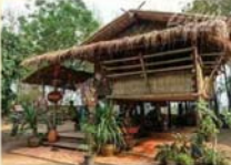
วิถีชีวิตชุมชน บ้านโป่งสนิม สวนไม้กวาด